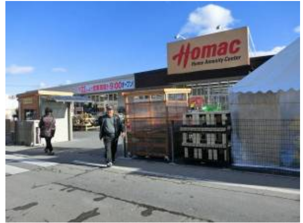
まちに活気が戻ってきています。多くの方が店を訪れています。