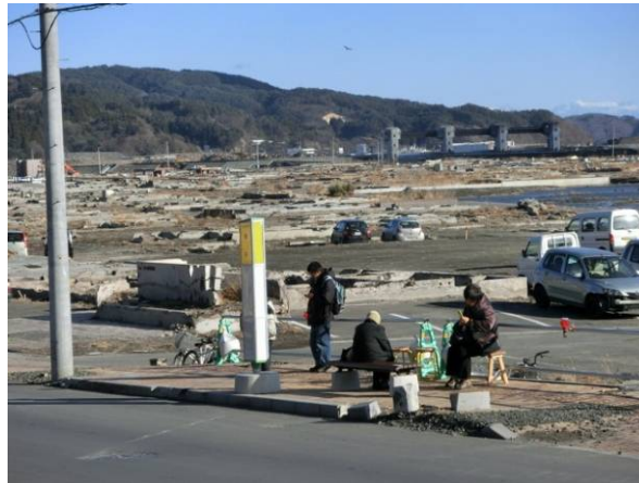
大槌町役場前の様子。がれきが撤去されました。復興食堂も近くに建てられ、賑わっています。