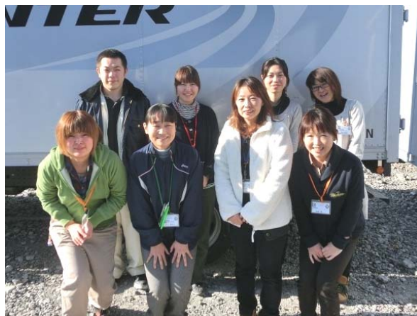
大槌町地域包括支援センターの職員のみなさまです。