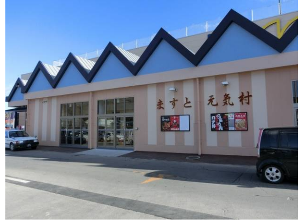
被災したショッピングセンターが12月末に復活しました。