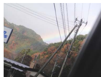
活動中に虹を発見！