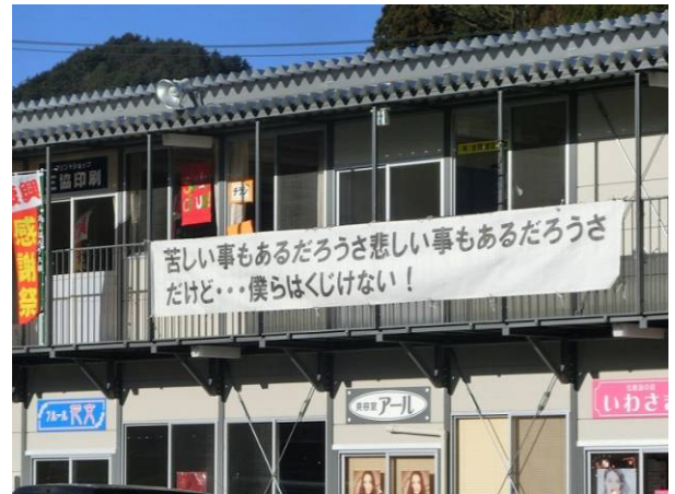
仮設商店街が、元気に営業中です。力強いメッセージが掲示されています。