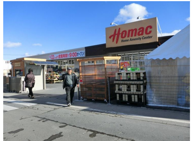
まちに活気が戻ってきています。多くの方が店を訪れています。