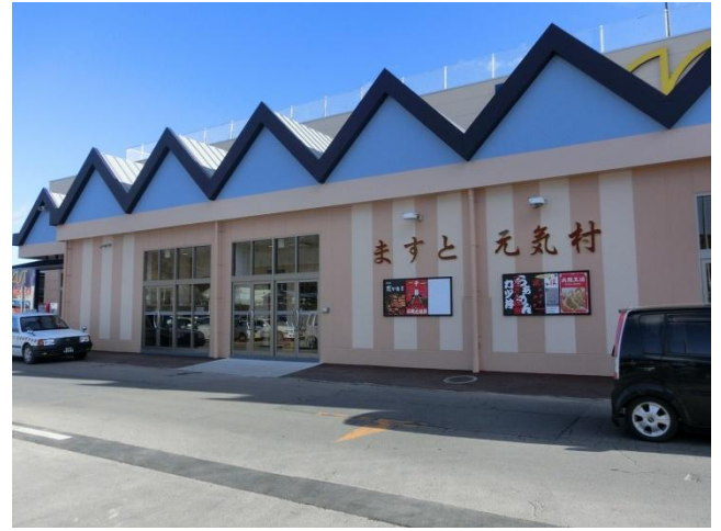
被災したショッピングセンターが12月末に復活しました。