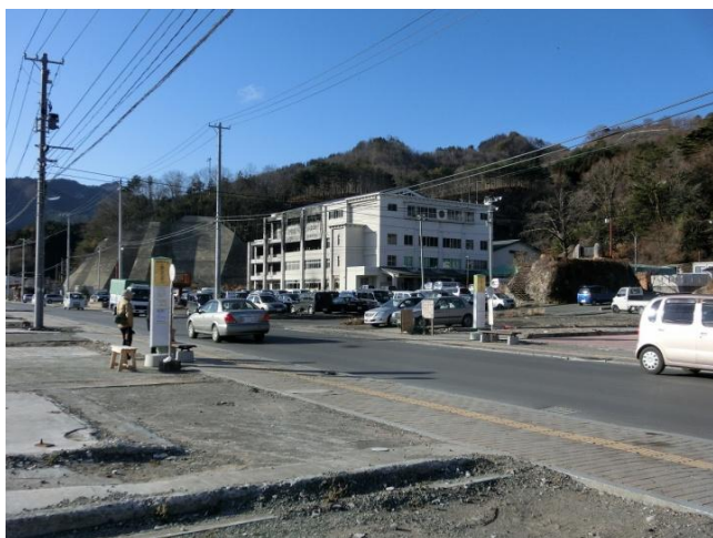
大槌町役場仮庁舎内の地域包括支援センターです。12月に新しい建物に引っ越しをされました。