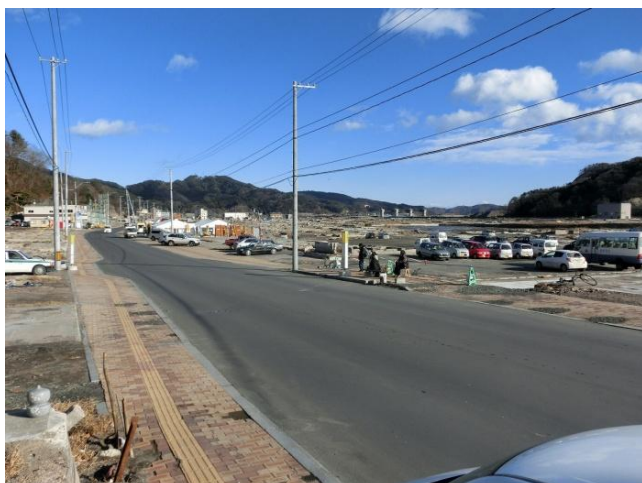
大槌町役場前の様子。がれきが撤去されました。復興食堂も近くに建てられ、賑わっています。

(2011年12月26日 大槌町地域包括支援センター撮影、コメント：日本社会福祉士会)