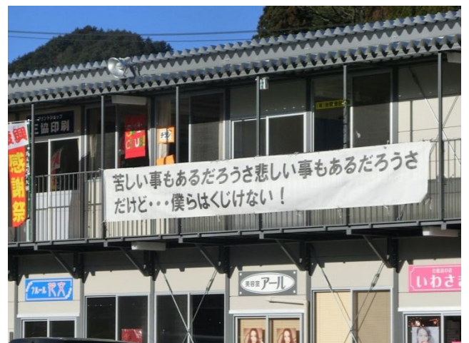
仮設商店街が、元気に営業中です。力強いメッセージが掲示されています。