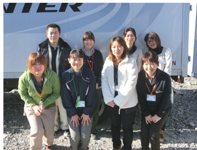
大槌町地域包括支援センターの職員のみなさまです。